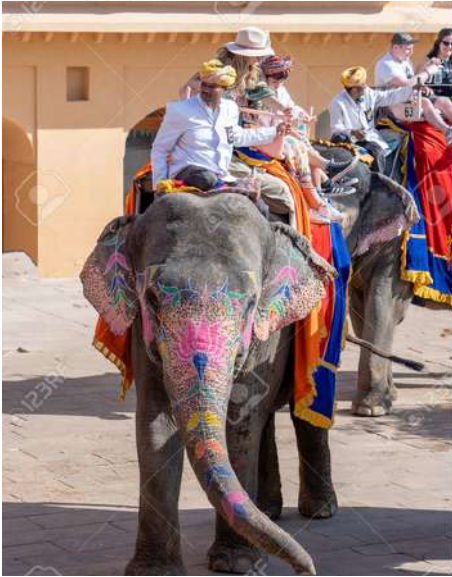
Jaipur (India) Turistas en elefantes.