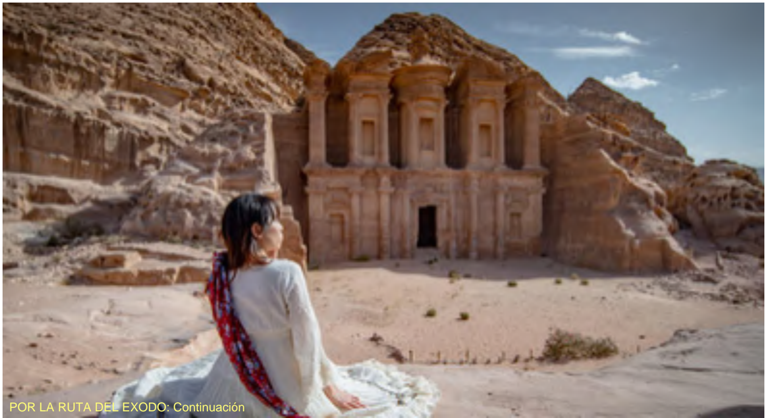
POR LA RUTA DEL EXODO: Continuación

Campo de los Pastores y la Iglesia de la Natividad. Regreso al hotel en Jerusalén y alojamiento.